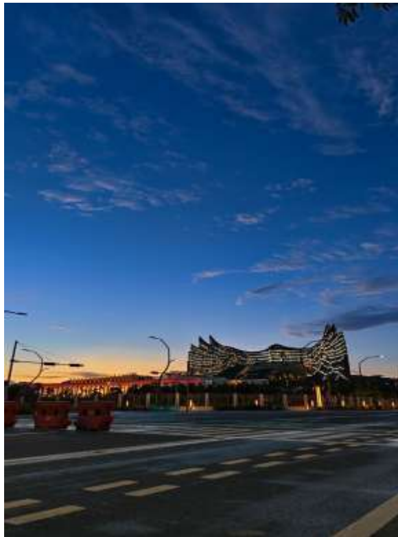
Gambar 2. 1 Lokasi Proyek

yaitu meliputi sistem manajemen energi listrik ,control dan monitoring ruangan Pergedung pada Ibu Kota Negara. pada penempatan ke proyek penulis ditemani oleh pembimbing melihat perkembangan proyek. selain itu penulis juga diberikan materi penjelasan mengenai komponen komponen yang digunakan.