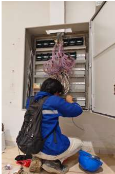
Gambar 2. 2 Instalasi Panel DDC

program yang di gunakan nantinya untuk mengontrol sesuatu atau di gunakan untuk memonitor dan membaca nilai sensor yang terpasang di IKN. Berikut ini beberapa gambar pekerjaan yang di lakukan selama di proyek: