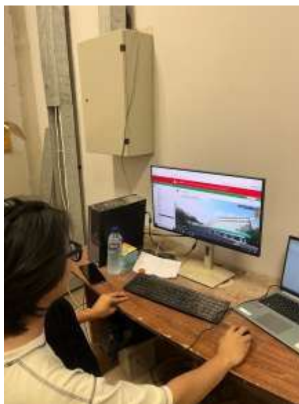
Gambar 2. 3 Grapchic dan Program BAS