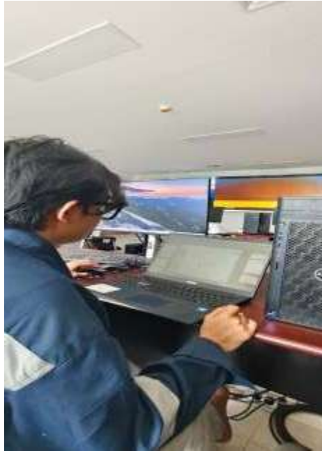
Gambar 2. 4 Membuat Pepingan Gambar Shop Drawing