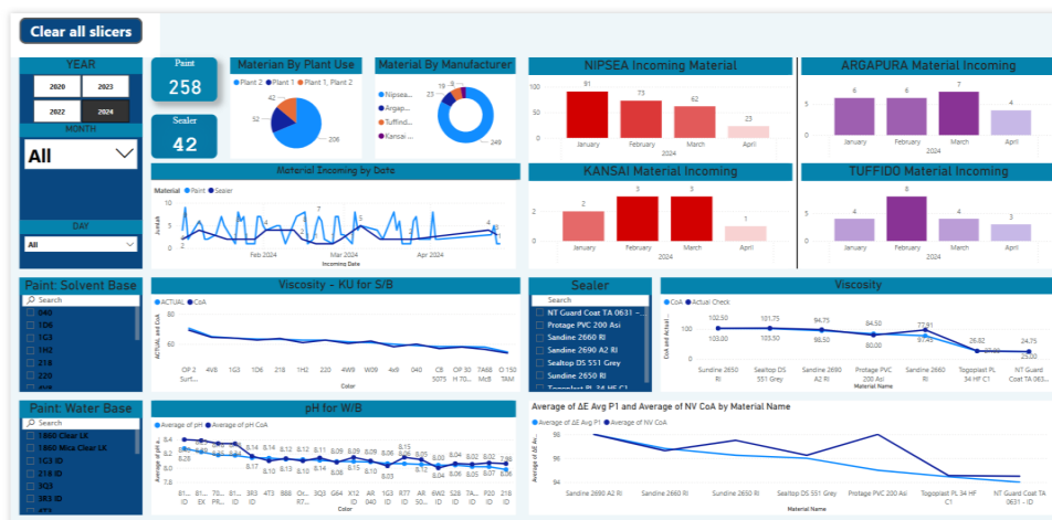
Gambar 4. Tampilan Dashboard Power BI

Peserta magang diberikan kewajiban untuk membawa tema proyek improvement sesuai dengan kondisi masing-masing dimana para peserta magang ditempatkan. Pada proyek JKK ini saya melakukan tema improvement “Creating Dashboard Visualization of Receiving Material (Paint & Sealer) Inspection Data in Chemical Laboratory Using Power BI” . Dengan mengolah data inspeksi pada material khusus nya di cat dan sealer saya membuat sebuah dashboard yang responsive menggunakan aplikasi Power BI untuk mempermudah dalam membaca dan menganalisa data inspeksi material yang ada.