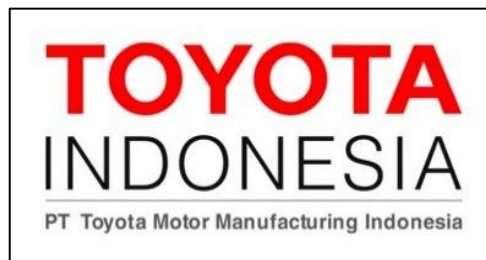
Gambar 1. Logo PT TMMIN

PT Toyota Motor Manufacturing Indonesia (PT TMMIN) adalah salah satu perusahaan otomotif terkemuka di Indonesia yang didirikan pada tahun 1971 yang telah memainkan peran penting dalam industri kendaraan bermotor. Berdiri sebagai bagian dari strategi ekspansi global Toyota Motor Corporation, PT TMMIN memiliki sejarah panjang yang dimulai sejak beberapa dekade yang lalu. Perusahaan ini telah menjadi pilar utama dalam produksi dan distribusi berbagai model mobil Toyota yang sangat populer di pasar domestik maupun internasional.