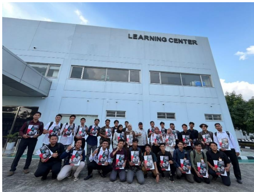
Gambar 3. Kegiatan Safety Dojo Training

Sebelum ditempatkan ke divisi masing-masing, para peserta magang diwajibkan untuk terlebih dahulu mengikuti training safety atau yang disebut dengan safety dojo training. Training ini sangat penting untuk memastikan setiap peserta magang memahami dan dapat menerapkan prinsip-prinsip Keselamatan dan Kesehatan Kerja (K3). Selama pelatihan ini, peserta magang mendapatkan paparan materi yang mendalam mengenai K3, yang meliputi berbagai aspek penting seperti identifikasi potensi bahaya, teknik menghindari bahaya, serta prosedur tanggap darurat.