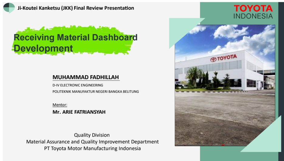
Gambar 5. Tampilan Awal Materi Presentasi

Selama proses penyusunan laporan, peserta magang akan dibimbing oleh mentor. Selain itu juga peserta magang akan mengikuti coaching clinic dengan advisor untuk mendapatkan masukan mengenai JKK Report yang sudah dibuat. Terakhir, hasil dari JKK Report ini akan disampaikan dalam bentuk presentasi menggunakan Power Point ke advisor pada tahap final review untuk mendapatkan evaluasi dan learning point