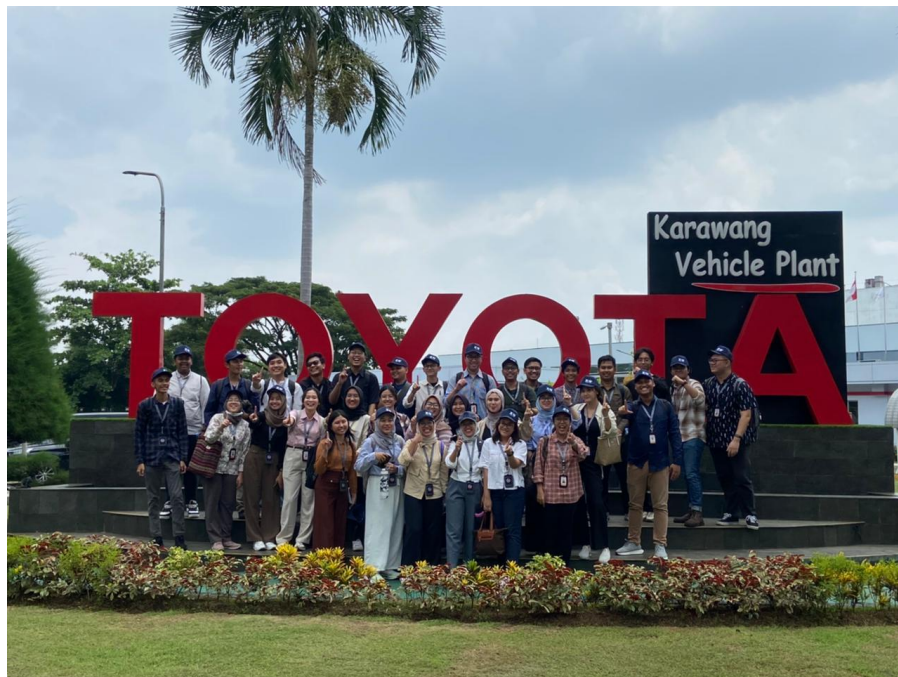
Gambar 6. Kunjungan ke xEV Center Toyota

dalam mempelajari kendaraan listrik. Di sini, kami diperkenalkan dengan teknologi terbaru dalam pengembangan baterai, motor listrik, dan sistem manajemen energi. Melihat prototipe kendaraan listrik dan melakukan uji coba memberi kami gambaran langsung tentang inovasi yang mendorong industri otomotif menuju kendaraan ramah lingkungan.